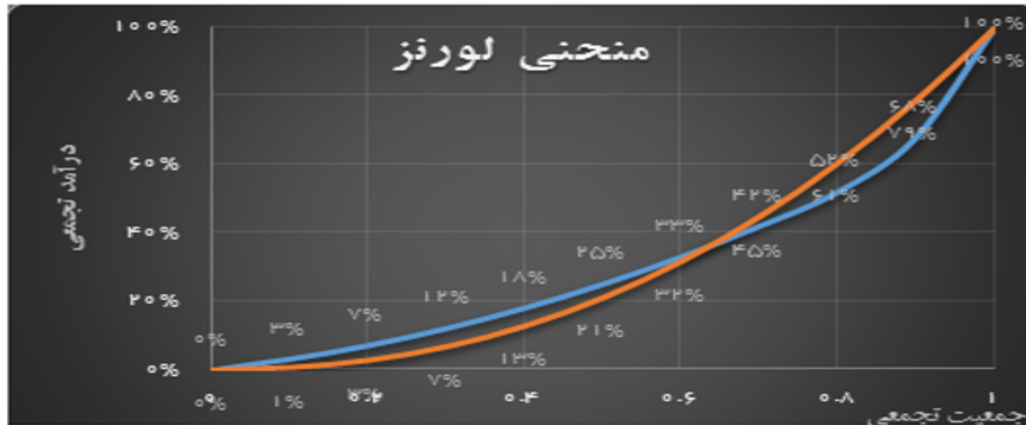
نمودار (۲-۲) منحنی‌های لورنز متقاطع

اگر منحنی لورنز در دو کشور مختلف به صورت نمودار (۲-۲) باشد، وضعیت توزیع درآمد در دو کشور متفاوت است، هر چند که دو کشور دارای ضریب جینی یکسانی هستند: